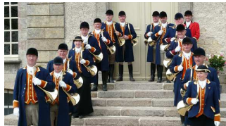
Les Trompes de Chasse de Saint Hubert du Bocage