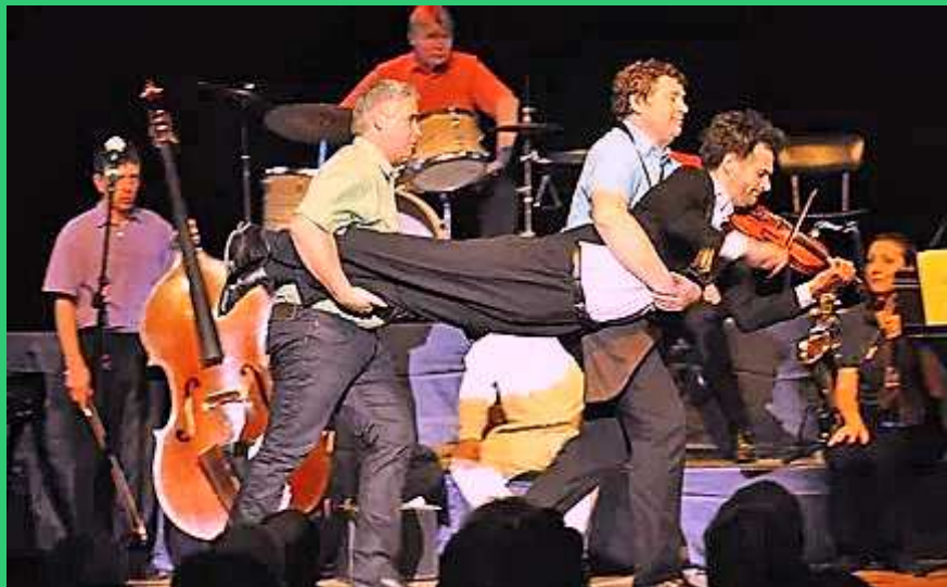
Festival Les Embruns de Musique : L'Orchestre du Grand Turc Arromanches, salle des fêtes, dimanche 27 août 17h00